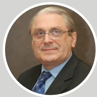
Мазуров Вадим Иванович

академик РАН, д.м.н., Главный научный консультант СЗГМУ им. И.И. Мечникова, заведующий кафедрой терапии и ревматологии им Э.Э. Эйхвальда СЗГМУ им.И.И. Мечникова, г. Санкт-Петербург